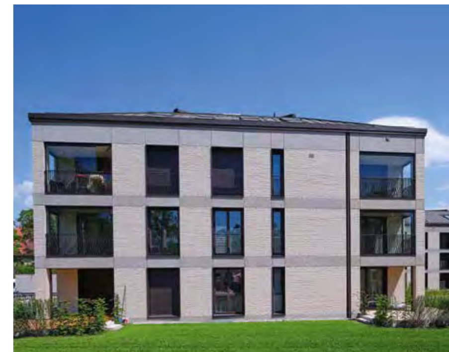
DEUTSCHES HEIM // Haar, Apfelwiese

Ausgehend von den EU-Prognosen dürften Italien und Spanien deutlicher und Frankreich in ähnlichem Umfang wie Deutschland (-2,0 %) hinter ihrem Vorkrisenniveau zurückbleiben. Insgesamt wurde die Konjunktur in Europa im weltweiten Vergleich stärker von der Coronakrise getroffen. In den USA schrumpfte die Wirtschaftsleistung im Jahr 2020 lediglich um 3,4 %. Für die Vereinigten Staaten erwartet die Europäische Kommission im Jahr 2021 ein Wirtschaftswachstum von 5,8 % und damit mehr Wachstum als in Deutschland und der EU.