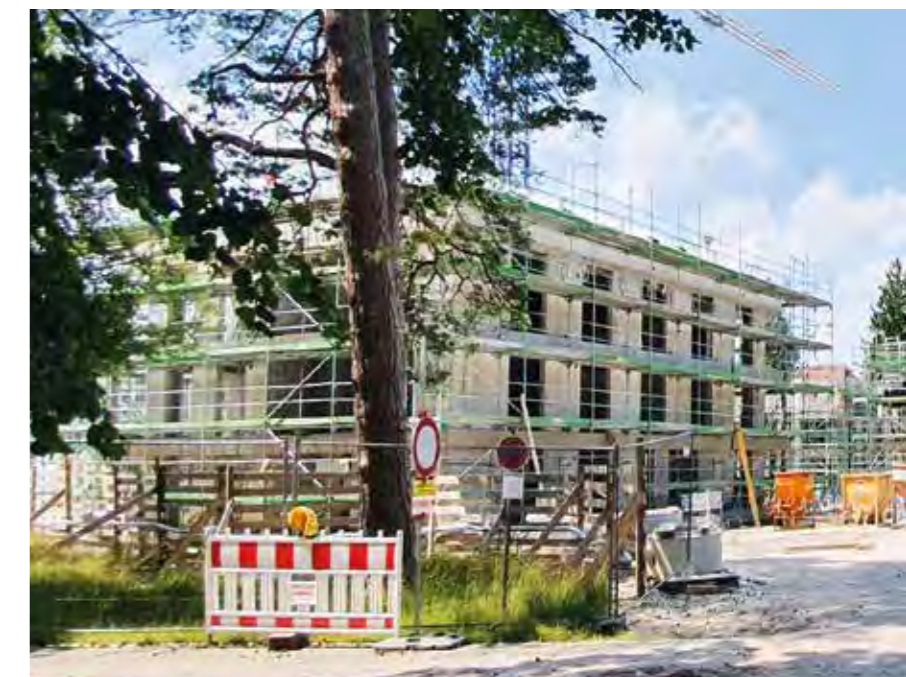
OBERBAYERISCHE HEIMSTÄTTE // Haar, Apfelwiese

Die Grundstücks- und Wohnungswirtschaft, die 2021 rund 10,8 % der gesamten Bruttowertschöpfung erzeugte, konnte die Wirtschaftsleistung nach einem geringen Rückgang in 2020 (-0,5%) in 2021 um 1 % steigern. Nominal erzielte die Grundstücks- und Immobilienwirtschaft 2021 eine Bruttowertschöpfung von 347 Milliarden €. Die Bedeutung der Immobilienwirtschaft als stabilisierender Sektor zeigt sich daran, dass die Grundstücks- und Wohnungswirtschaft im Gegensatz zu vielen anderen Wirtschaftssektoren ihre Wirtschaftsleistung im Vergleich zum Vorpandemiejahr 2019 um 0,6 % steigern konnte.