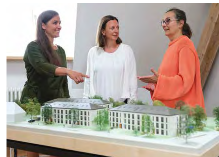
KONZERN // Kommunikation

Infolge des Ukraine-Krieges gehen wir kurzfristig von einem Anstieg der Nachfrage nach bezahlbarem Wohnraum aus. Der starke Anstieg der Baupreise sowie der Kapazitätsmängel im Baugewerbe machen sich auch regional bemerkbar.