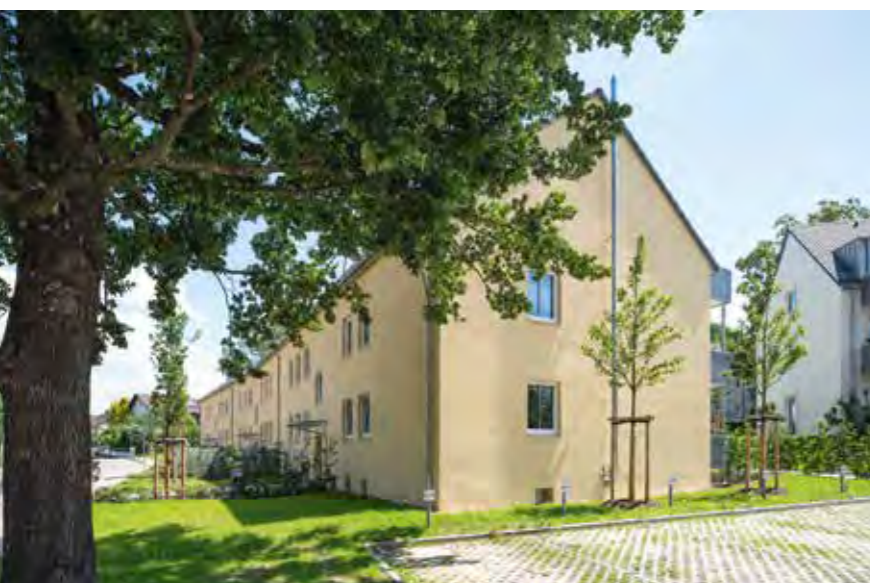
OBERBAYERISCHE HEIMSTÄTTE // Schrobhausen, Prälat-Alberstötter-Straße

Nur durch die Ausweitung des Angebotes durch entsprechende Anreizsysteme und vereinfachte Bauvorschriften können ausreichend preisgünstige Wohnungen geschaffen werden. Die politischen Rahmenbedingungen für eine Ausweitung des Angebotes sind derzeit immer noch nicht in ausreichendem Umfang vorhanden. Die kurzfristige Abschaffung von Fördermaßnahmen trägt nicht zur Vertrauensbildung und zur Kalkulierbarkeit bei der Umsetzung langfristiger Bauprojekte bei. Bei weiterer Verschärfung gesetzlicher Rahmenbedingungen und zu erwartenden negativen Auswirkung auf die Ertrags- und Finanzlage ist es unter Umständen erforderlich, Anpassungen der geplanten Investitionsprojekte vorzunehmen.