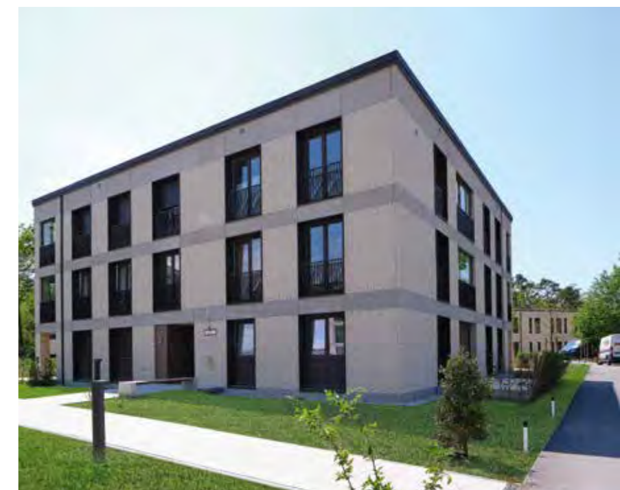
DEUTSCHES HEIM // Haar, Apfelwiese