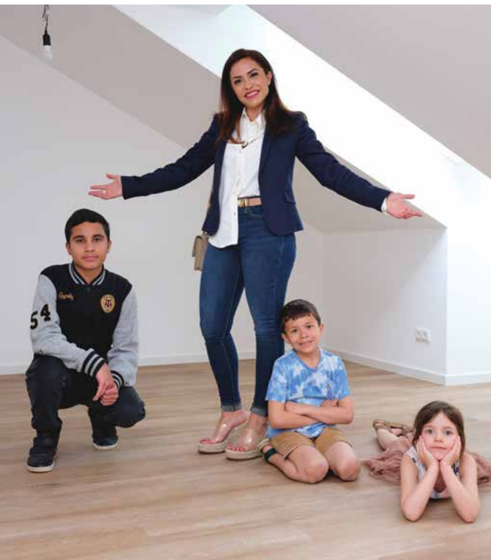
Mieter in Haar, Apfelwiese

Unser Kerngeschäft liegt in der Vermietung sowie der Betreuung, der Instandhaltung, dem Neubau von Wohnraum und der nachhaltigen Modernisierung unseres Wohnungsbestandes mit rund 6.000 Mietwohnungen in Oberbayern. Zudem sind wir als Wohnungsunternehmen mit gesellschaftlicher Verantwortung ein starker und vertrauensvoller Ansprechpartner für zahlreiche Städte und Gemeinden in Oberbayern.