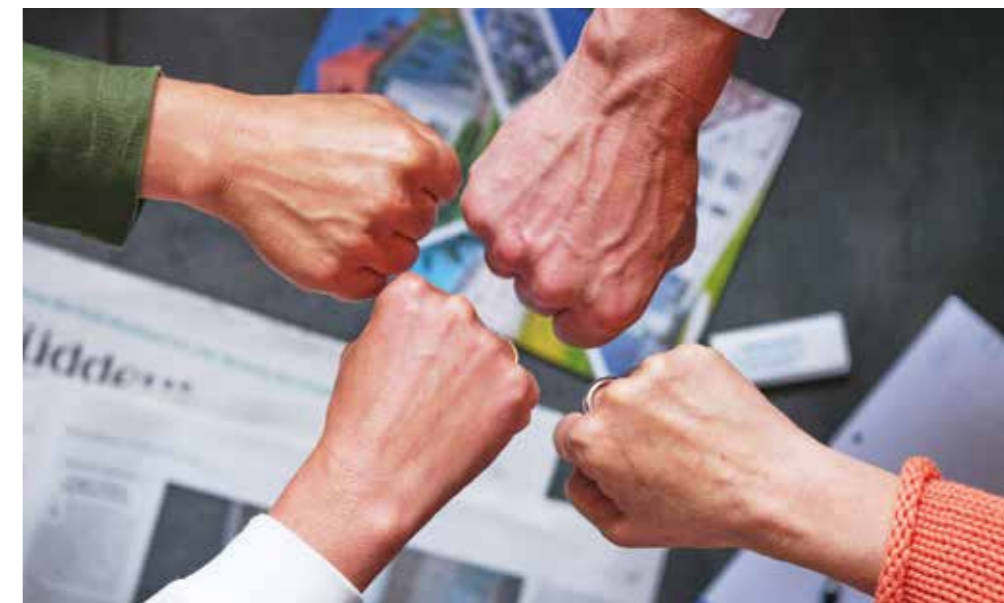
Ein starkes Team

Wir nehmen unseren gesamtgesellschaftlichen Auftrag als Wohnungsunternehmen ernst und wollen unsere Verantwortung weiterdenken – in Bezug auf Menschlichkeit und Nachhaltigkeit. Das heißt für unsere Überzeugung: Wir sind fair, modern und nachhaltig in unseren Mietpreisen, unserer Wohnqualität, unserer Bau- und Sanierungsweise. Aber auch in unserer Haltung den Mietern, unseren Mitarbeitern und ihren Bedürfnissen gegenüber.