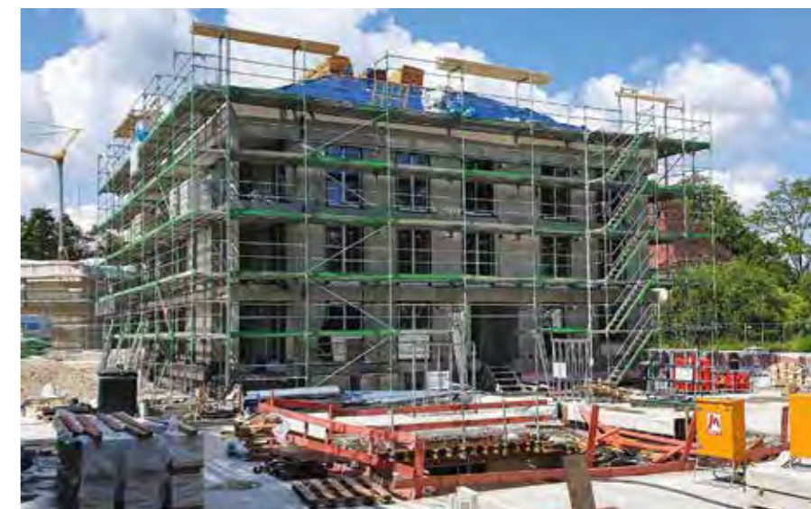
DEUTSCHES HEIM // Haar, Apfelwiese

Die teilweise sehr hohen Kauf- und Mietpreise sowie das karge Objektangebot in München lassen zahlreiche Interessenten in die umliegenden Landkreise ausweichen. Gemeinden mit einer guten Anbindung an die Landeshauptstadt sowie einer vorteilhaften sozialen Infrastruktur, Kinderbetreuungs- und Bildungseinrichtungen sowie Einkaufsmöglichkeiten vor Ort bzw. in naher Umgebung werden vielfach vorausgesetzt, erfreuen sich seit vielen Jahren großer Beliebtheit. Mit zunehmender Flexibilität im Arbeitsleben durch Homeoffice-Regelungen werden vermehrt auch weitere Entfernungen zu den regulären Arbeitsstätten in Kauf genommen.