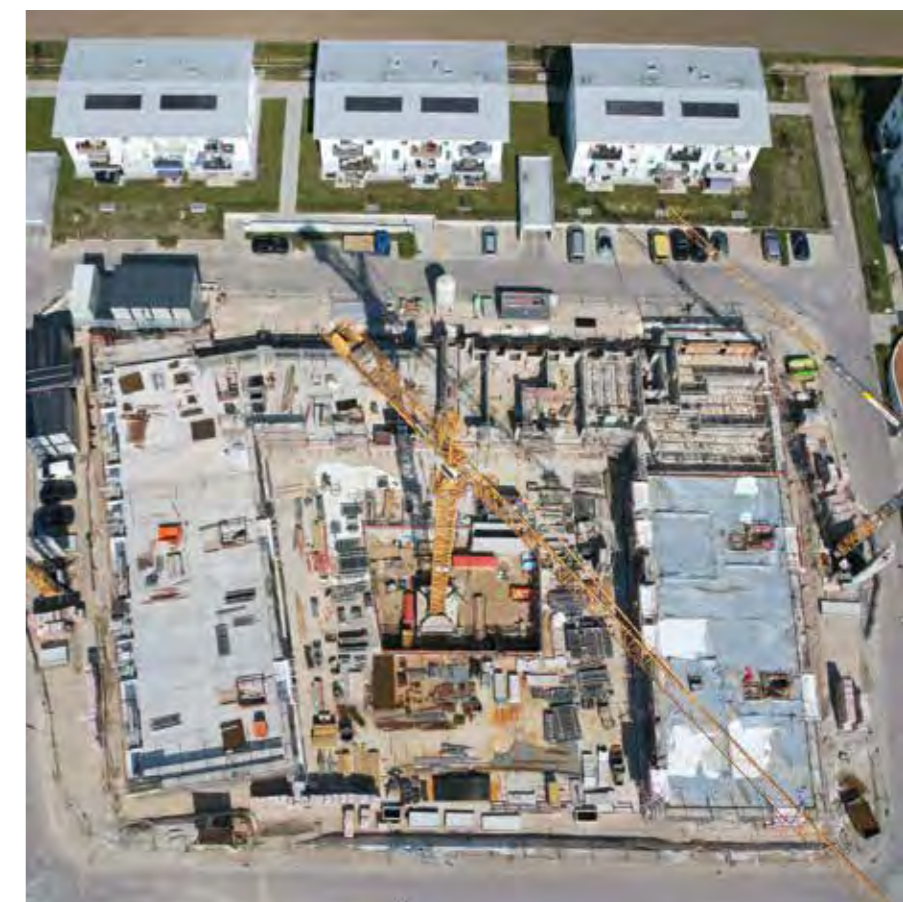
OBERBAYERISCHE HEIMSTÄTTE // Erding, Thermengarten

Die Umsatzerlöse aus der Hausbewirtschaftung (46,6 Mio. €) haben sich gegenüber dem Vorjahr (45,5 Mio. €) positiv entwickelt. Die Umsatzsteigerung resultiert im Wesentlichen aus der Fertigstellung von Neubauten/Erweiterungen und Modernisierungen von Wohngebäuden im Vorjahr sowie im geringeren Umfang im Berichtsjahr. Die Durchschnittsmiete aller eigenen Wohnungen stieg pro Quadratmeter Wohnfläche von 7,63 € (Stand 31.12.2020) auf 7,79 € (Stand 31.12.2021) an. Die Verminderung des Betriebsergebnisses ist vor allem auf die Zunahme der Instandhaltungskosten zurückzuführen. Darin sind 0,6 Mio. € Erhaltungsaufwendungen aus der Modernisierungsmaßnahme