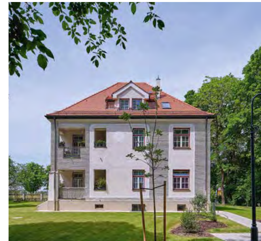
OBERBAYERISCHE HEIMSTÄTTE // Haar, Vockestraße

Das Eigenkapital der Gesellschaft i.H.v. 176,6 Mio. € (Vorjahr: 169,2 Mio. €) beträgt 35,3 % (Vorjahr: 35,5 %) der Bilanzsumme. Die Eigenmittel einschließlich der Rückstellung für Bauinstandhaltung belaufen sich auf 36,4 % (Vorjahr: 36,7 %).