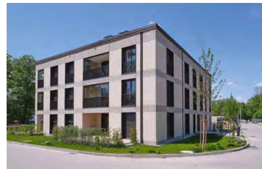
DEUTSCHES HEIM // Haar, Apfelwiese