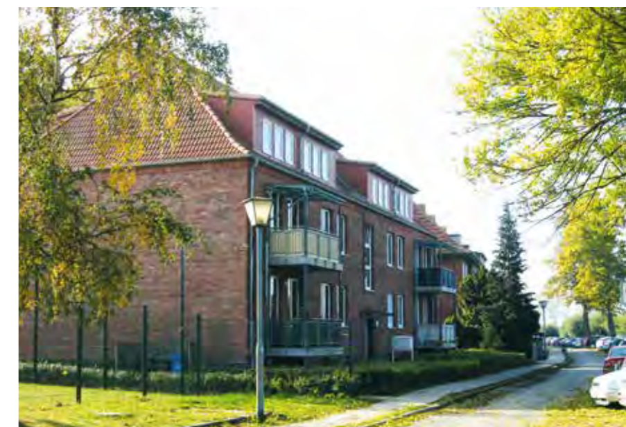
DEUTSCHES HEIM // Stralsund, August-Bebel-Ufer

Die Geschäftsführung von DEUTSCHES HEIM ist mit dem abgelaufenen Geschäftsjahr insbesondere aufgrund der guten Ertragslage aus der Bauträgertätigkeit sehr zufrieden.