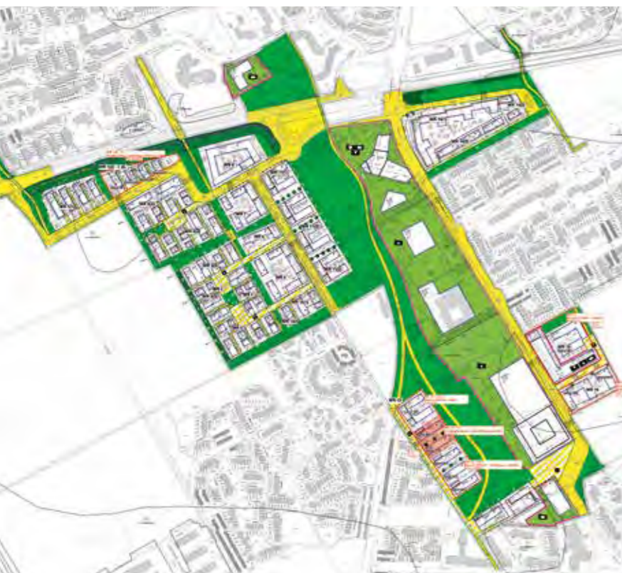
DEUTSCHES HEIM // Bebauungsplan Kirchheim

Im Bauquartier Q 7.2 wurden 2021 20 Wohneinheiten und 26 Stellplätze verbrieft. Zum Jahresende erfolgte die Übergabe von zwei Mehrfamilienhäusern (30 ETW: 12.813,5 T€) zusammen mit der Tiefgarage (40 Stpl.: 913,0 T€). Im Herbst erfolgte der Baubeginn im Quartier 7.3 des Jugendstilparks. Hier werden drei Mehrfamilienhäuser (72 ETW) in Verbindung mit einer Tiefgarage (102 Stellplätze) errichtet. Die ersten Kaufvertragsabschlüsse erfolgen im Januar 2022.