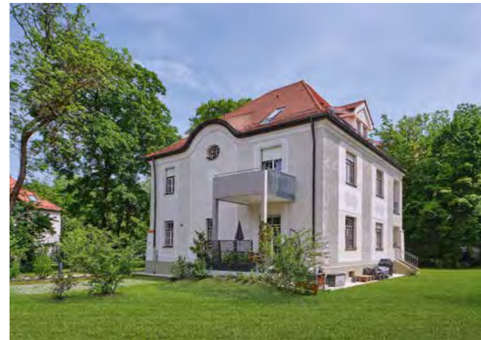
Modernisierung einer denkmalgeschützten Jugendstilvilla in Haar

Unser Ziel ist es, zusammen mit unseren Kunden und Geschäftspartnern Lebensräume zu schaffen. Ob in der städtebaulichen Entwicklung oder in der individuellen Planung von Wohnsituationen. Wir sehen uns als Partner für unsere Mieter und Kommunen. Dabei ist es uns und unseren Mitarbeitern wichtig, dass alle Beteiligten auf Augenhöhe und im Miteinander handeln, um gemeinsam eine lebenswerte Zukunft zu gestalten.