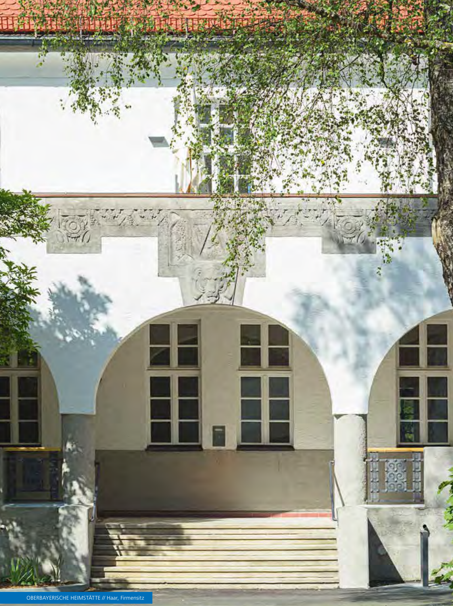
OBERBAYERISCHE HEIMSTÄTTE // Haar, Firmensitz