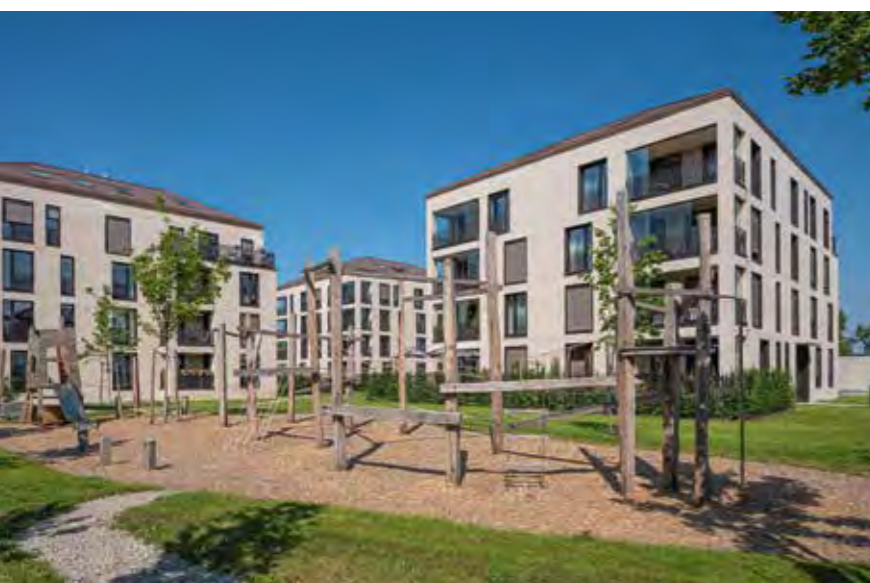
DEUTSCHES HEIM // Haar, Jugendstilpark