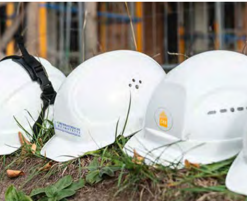
KONZERN // Zusammenarbeit

Die Grundstücks- und Wohnungswirtschaft, die 2021 rund 10,8 % der gesamten Bruttowertschöpfung erzeugte, konnte die Wirtschaftsleistung nach einem geringen Rückgang in 2020 (-0,5%) in 2021 um 1 % steigern. Nominal erzielte die Grundstücks- und Immobilienwirtschaft 2021 eine Bruttowertschöpfung von 347 Milliarden €. Die Bedeutung der Immobilienwirtschaft als stabilisierender Sektor zeigt sich daran, dass die Grundstücks- und Wohnungswirtschaft im Gegensatz zu vielen anderen Wirtschaftssektoren ihre Wirtschaftsleistung im Vergleich zum Vorpandemiejahr 2019 um 0,6 % steigern konnte.