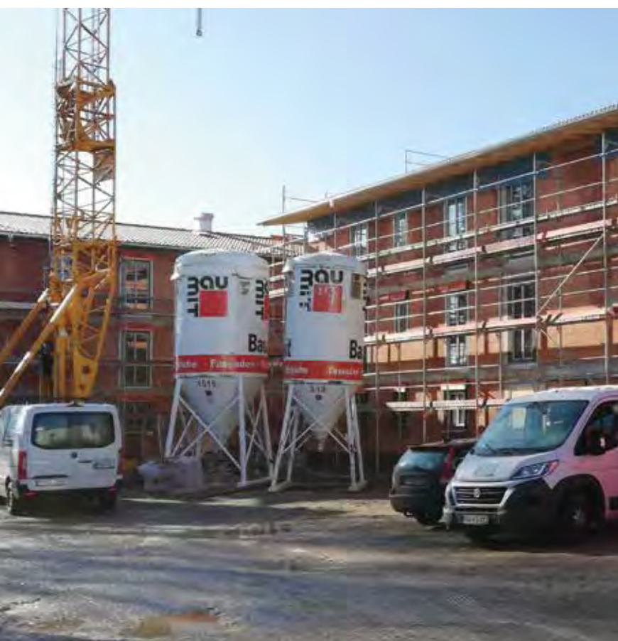
OBERBAYERISCHE HEIMSTÄTTE // Bruckmühl, Justus-von-Liebig-Straße

Aufgrund der Vielzahl der Standorte des Wohnungsbestandes der OBERBAYERISCHE HEIMSTÄTTE in Oberbayern mit unterschiedlichen Wohnungsteilmärkten ist eine allgemeingültige Beschreibung der aktuellen und künftig erwarteten Entwicklung der Mietpreise und der Nachfrage aber nur eingeschränkt möglich.