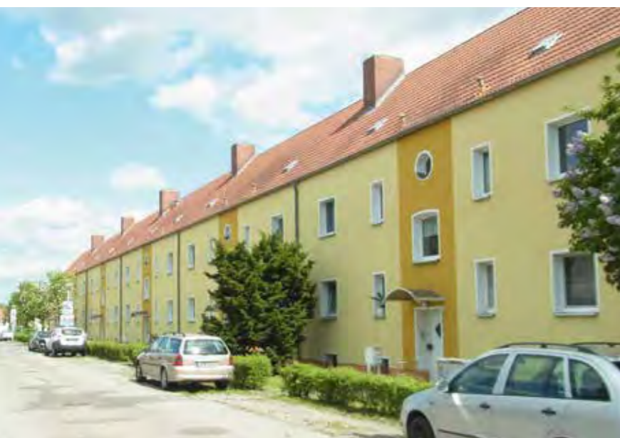
DEUTSCHES HEIM // Brandenburg, Prötzelweg

Der Bebauungsplan Nr. 28 „Wohnanlage Villa Clara Hafestraße“ wurde als Satzung im Dezember 2014 beschlossen. Am 14.03.2017 wurde der städtebauliche Vertrag zwischen DEUTSCHES HEIM und der Stadt Sassnitz geschlossen; somit ist der bisher aufschiebend bedingte Bebauungsplan 28 „Villa Clara“ rechtskräftig.