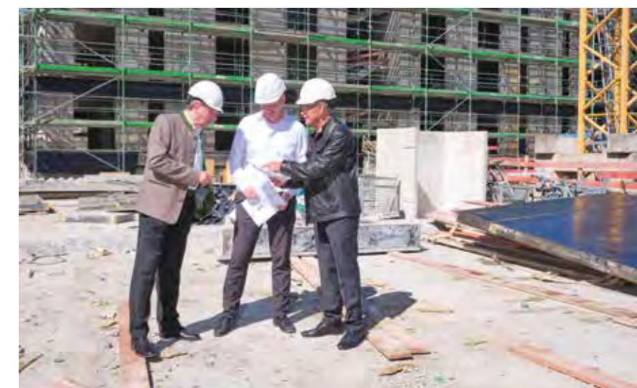
OBERBAYERISCHE HEIMSTÄTTE // Haar, Apfelwiese

Infolge der Unangemessenheit oder des Versagens von internen Verfahren, Menschen und/oder Systemen können für die Gesellschaft Risiken entstehen. Die Gesellschaft hat zur